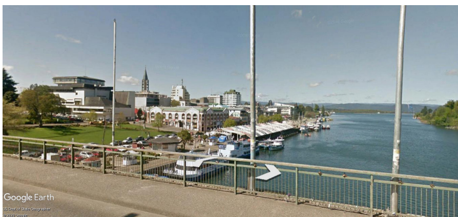
Figura 2. Valdivia en 2020, el mismo borde fluvial, pero desde la vista contraria.

La tensión planteada va un poco más allá, pues Valdivia se reconstruyó basándose en el plan que propuso Fogle, siendo las corporaciones dedicadas al espacio urbano y a