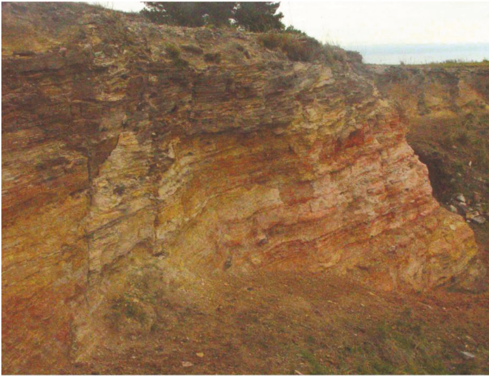
Figura 4. Arcillas La Numancia

de Rayos X Dispersiva en Longitud de Onda (FRXWD), Fluorescencia de Rayos X con Geometría de Reflexión Total (FRXT). Asimismo se emplearon Difracción de Rayos X (DRX) y espectrometría Raman. Todos estos estudios se realizaron en los laboratorios de la Comisión Nacional de Energía Atómica (CNEA). Estas técnicas no requieren una preparación especial de las muestras, con el beneficio adicional de tratarse de análisis no destructivos de modo que las mismas pueden ser utilizadas para análisis complementarios. Si bien en la técnica de DRX, la muestra se utiliza preferentemente en polvo para asegurar la distribución al azar de los cristales y disminuir el efecto de la orientación preferencial, al emplear directamente los fragmentos cerámicos se logró obtener una mayor información sobre la composición superficial en relación con la matriz y por ende sobre los pigmentos utilizados para la decoración. Del mismo modo fueron estudiados los colorantes obtenidos en canteras actua-