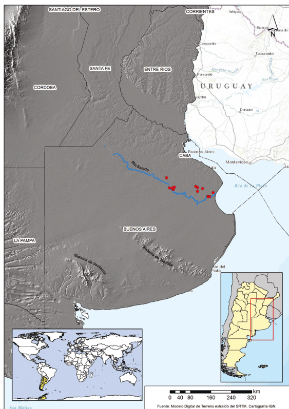
Figura 1. Mapa con la ubicación de los sitios mencionados en el trabajo.

En la provincia de Buenos Aires (Argentina), considerando las diferencias sedimentológicas, fisiográficas y geomorfológicas, se distinguen, entre otras áreas, la pampa ondulada, la pampa deprimida y la pampa alta o pampa inter-serrana (Zárate 2009 y referencias allí citadas). La pampa deprimida que comprende la cuenca hídrica del río Salado, donde se ubican los sitios aquí trabajados, se caracteriza por la dominancia de gradientes muy bajos, drenaje superficial deficiente y la presencia de geofomas eólicas (Zárate 2009). Incluye en su cuenca una gran cantidad de lagunas permanentes y temporarias con salinidad variable, su régimen hidrológico presenta alternancias de inundaciones y sequías (Figura 1). Esta extensa planicie está cubierta principalmente por pastos y también presenta, en la cuenca inferior bosques conformados por talas ( Celtis tala ) asociados con otras especies arbóreas como coronillo ( Scutia buxifolia ), sombra de toro ( Jodina rhombifolia ), duraznillo negro ( Cestrum parqui ), molle