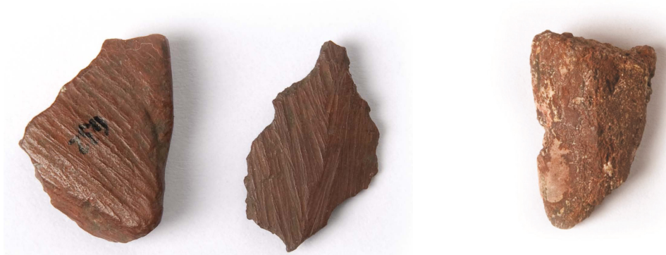
Figura 7. Fragmentos de pigmentos arqueológicos con estrías.