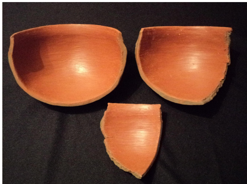
Figura 10 Fragmentos de vasija experimental con aplicación de pigmentos

ron los colorantes aplicándolos por frotación sobre la superficie de las paredes de recipientes experimentales y por otro lado se efectuó la molienda de los pigmentos para ser empleados en las mezclas con diluyentes (Francese 2000 y González 2005). La pulverización de los pigmentos fue hecha por la ceramista Lic. Francese empleando un mortero de porcelana. Según comunicación personal de la ceramista, el material colorante proveniente de La Liebre resultó extremadamente duro y difícil de moler, en cambio los de La Numancia fueron relativamente blandos, por lo cual su reducción a polvo fue comparativamente rápida. Las sustancias colorantes se mezclaron con la misma arcilla con la que se manufacturaron las vasijas (50% de pigmento y 50% de arcilla humedecida con agua) obteniendo una mezcla espesa. En otros casos se usó solo el polvo del pigmento molido y se agregó agua obteniéndose una mezcla menos espesa que la del caso mencionado anteriormente. Otra observación de la ceramista fue que cuando las paredes