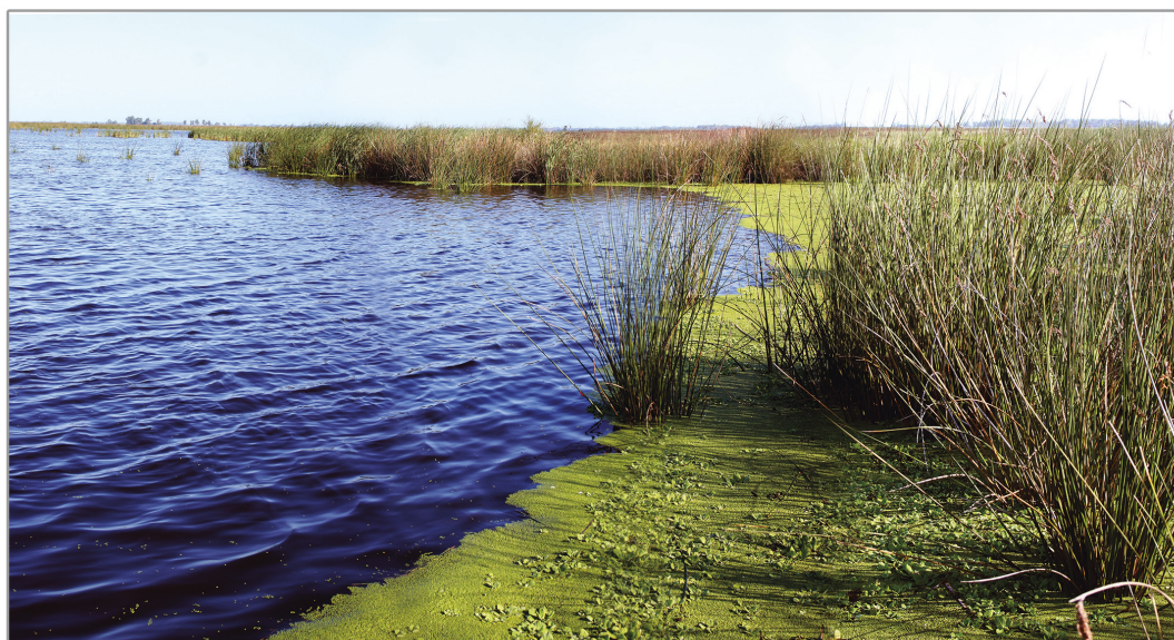
Figura 2. Ambiente: paisaje río Salado y montes de tala, laguna pampeana.

( Schinus longifolius ), sauco ( Sambucus australis ) y brusquilla ( Colletia spinosissima ) (Figura 2). Desde el punto de vista ecológico, los bosques ocupaban el norte y noreste de la provincia de Buenos Aires, llegando hasta el río Salado (Parodi 1940 a y b en González y Frère 2009). El ambiente de humedal en que se encuentran los yacimientos estudiados presenta una rica biodiversidad.