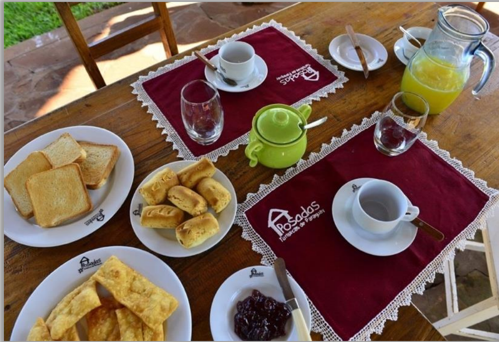
Imagen 4. Fotografía difundida en prensa para promocionar a las posadas