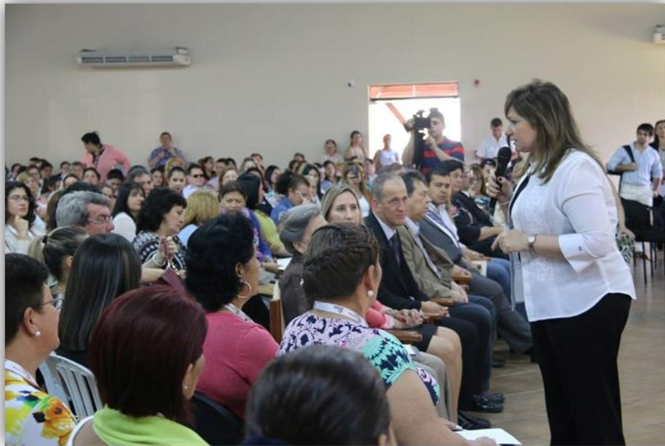
Imagen 7. Primer Foro Nacional de Emprendedoras en Turismo