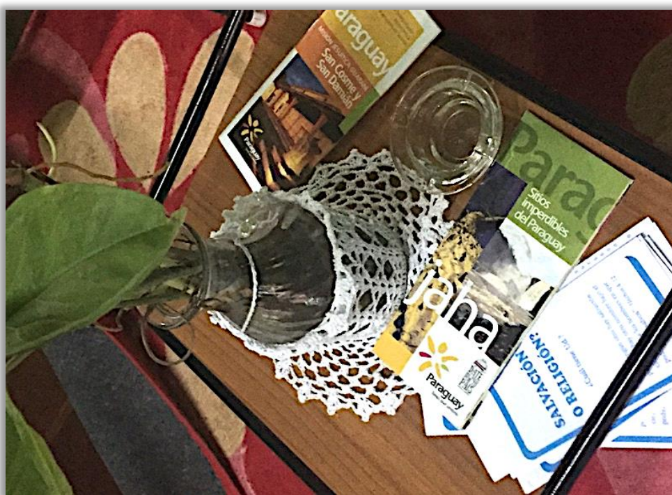
Imagen 5. Folletos disponibles en la posada