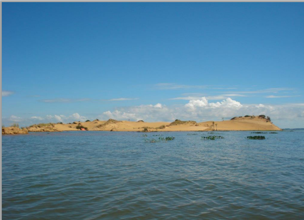
Imagen 2. Dunas de San Cosme y Damián (2006)