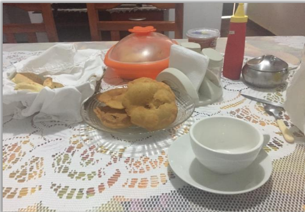
Imagen 3. Desayuno servido en la posada