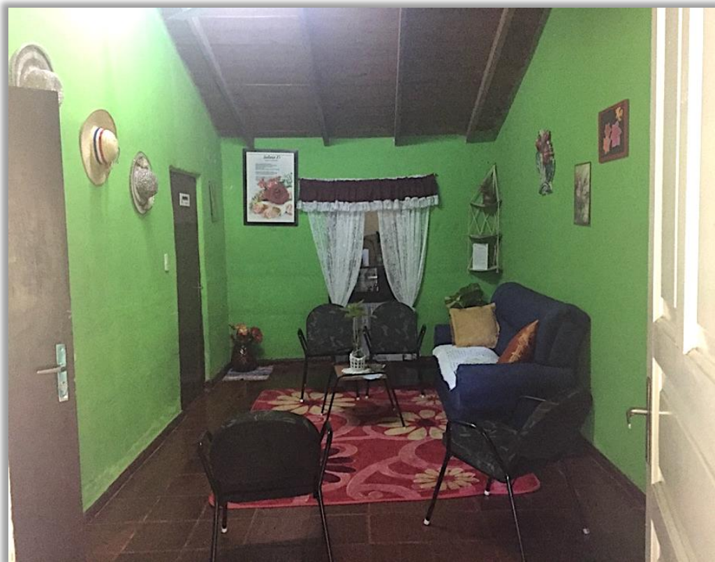
Imagen 6. Sala de estar de la posada.