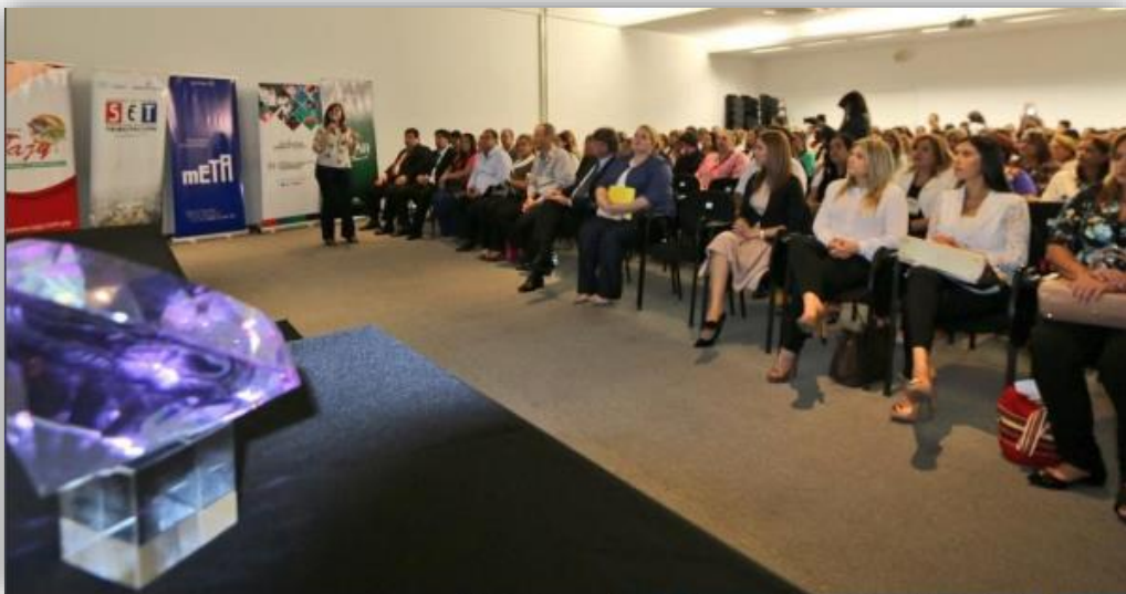
Imagen 8. Apertura del II Foro Nacional de Emprendedores en Turismo